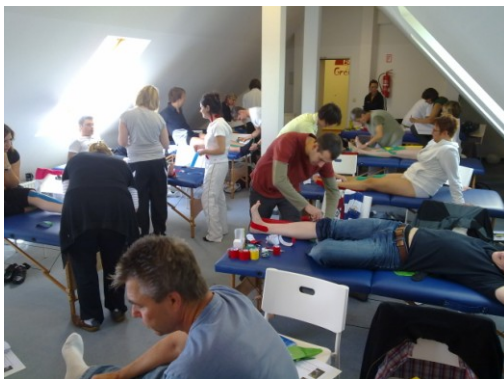
für bis zu 30 Teilnehmer