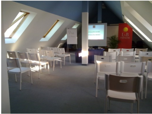
Vortrags und Schulungsraum I für bis zu 50 Personen