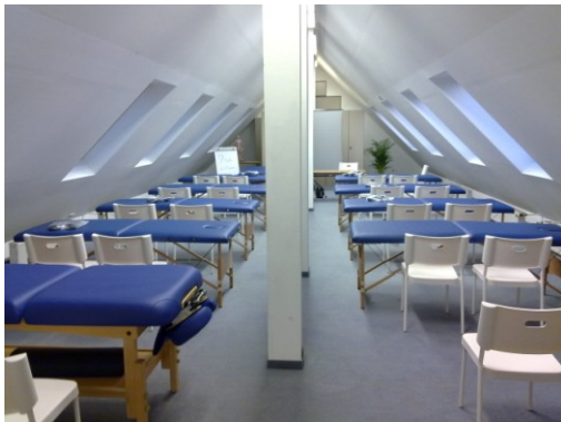
Ausstattung mit Liegen