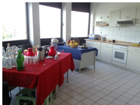
Lehrküche mit 3 Küchenzeilen Platz für bis zu 18 Personen