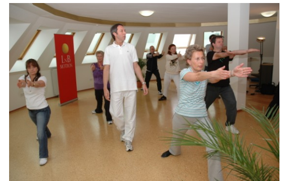
Viel Platz für Bewegung