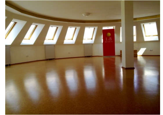
Vortrags und Schulungsraum II obere Etage