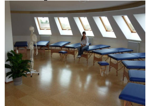
Ausstattung mit Liegen oder Tischen für bis zu 40 Personen